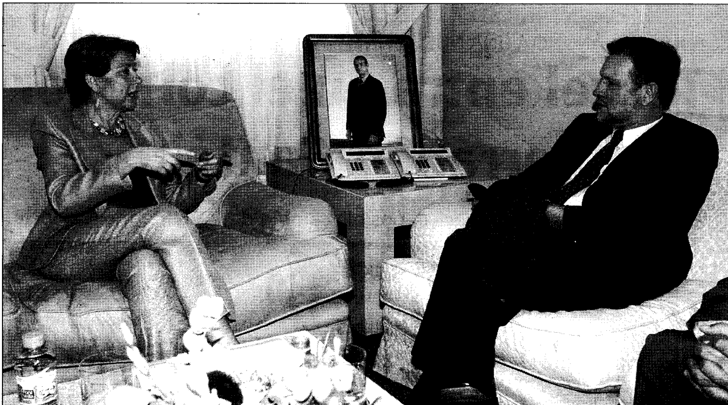
Magdalena Álvarez con el presidente del Gobierno de Aragón, Marcelino Iglesias, en la reunión que mantuvieron ayer en Madrid

Álvarez no concretó plazos ni presupuestos al tratarse de un acuerdo alcanzado ayer mismo y estar pendiente por tanto de establecer diseños, presupuestos, fechas y estudios. Sí indicó que la mitad del trazado será de nueva creación, el correspondiente al eje Sagunto-Zaragoza, y en el resto (Zaragoza-Logroño-Vitoria) se mejorarán las condiciones de la vía para adaptar a alta velocidad.