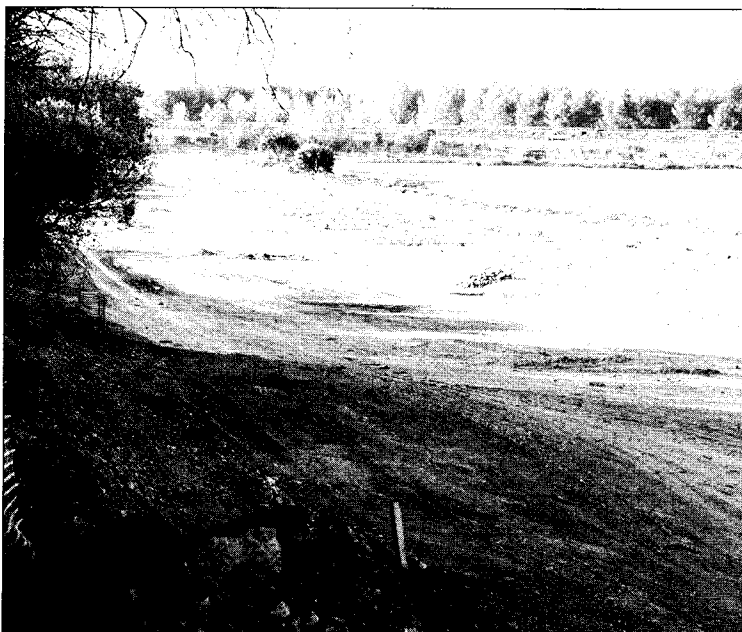
Imagen de las obras de la variante del ferrocarril cerca de la autovía.

El proyecto del nuevo ramal de vía requiere el trazado provisional de un nuevo tramo carretero para facilitar la construcción de la obra