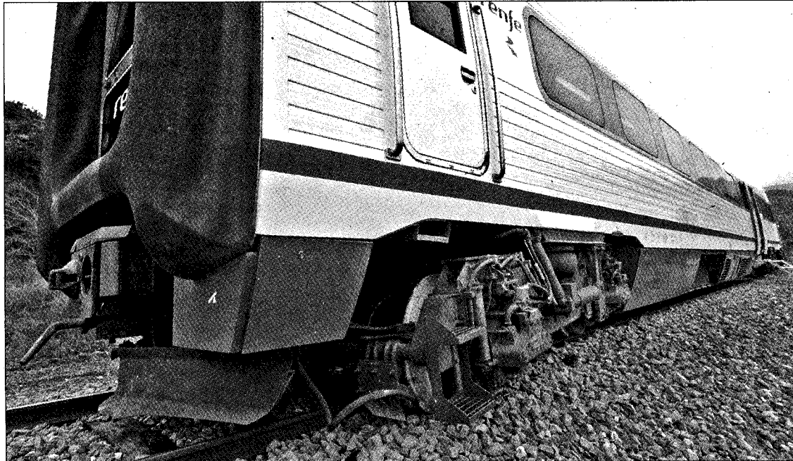
Así quedó el tren tras descarrilar.