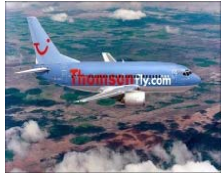
La nueva línea operará desde el 27 de diciembre

Los usuarios de este vuelo podrán beneficiarse de un transfer gratuito Zaragoza – Huesca – Zaragoza; el precio lineal no sujeto a disponibilidad (el primer asiento cuesta lo mismo que el último); veinte kilos de equipaje por pasajero y llegada al aeropuerto londinense de Gatwick (situado a tan sólo a 35 minutos en el Gatwick Express de London Victoria); lunch gratuito a bordo; y una oferta horaria pensada para la comodidad del viajero.